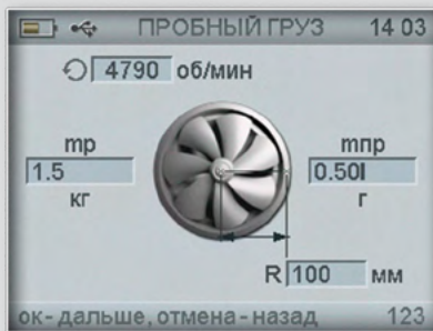
Расчет и установка пробного груза