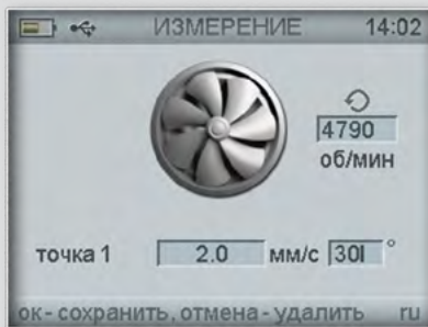
Измерение амплитуды вибрации и фазы