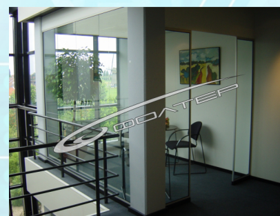
Встроенные в конструкцию помещения

Комнаты оснащены освещением и системой автоматики, определяющей присутствие курильщиков. По заказу могут изготавливаться комнаты других типоразмеров и другого дизайна. Системой очистки воздуха от табачного дыма могут быть оборудованы также существующие помещения (места) отведенные для курения. В этом случае разработка проекта системы очистки воздуха проводится по техническому заданию заказчика.