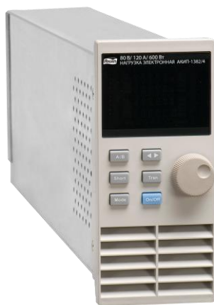
АКИП-1382/4 (модуль для установки в шасси)