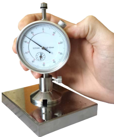
Рисунок 2.2 – Прибор во время проведения измерения