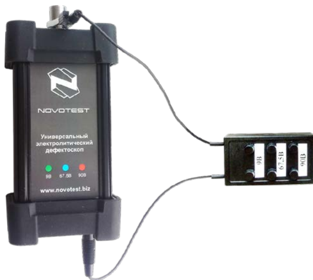
Рисунок 1.3 – Подключение блока тестирования к прибору

Для проверки работоспособности прибора необходимо к электронному блоку подсоединить блок тестирования (рис. 1.3).