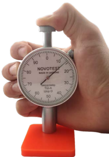
Рисунок 2.2 – Твердомер NOVOTEST ТШ-А во время проведения измерения