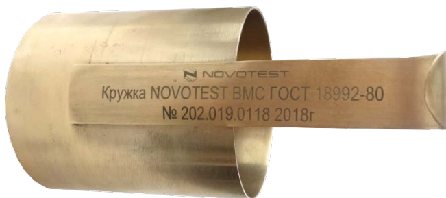
Рисунок 1.2 – Расположение данных о приборе

На ручку прибора наносится условное обозначение прибора с товарным знаком предприятия-изготовителя, заводской номер и год выпуска (рис. 1.2).