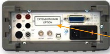
Внешний вид задней панели (B7-78/1)

Интерфейс GPIB (КОП) или RS-232, 10 кан./ 20 кан. сканер для B7-78/1