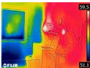
Неизолированная наружная стена