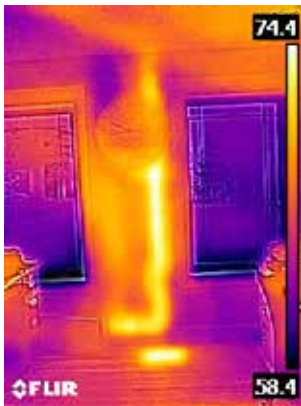
Теплая отводная труба в стене