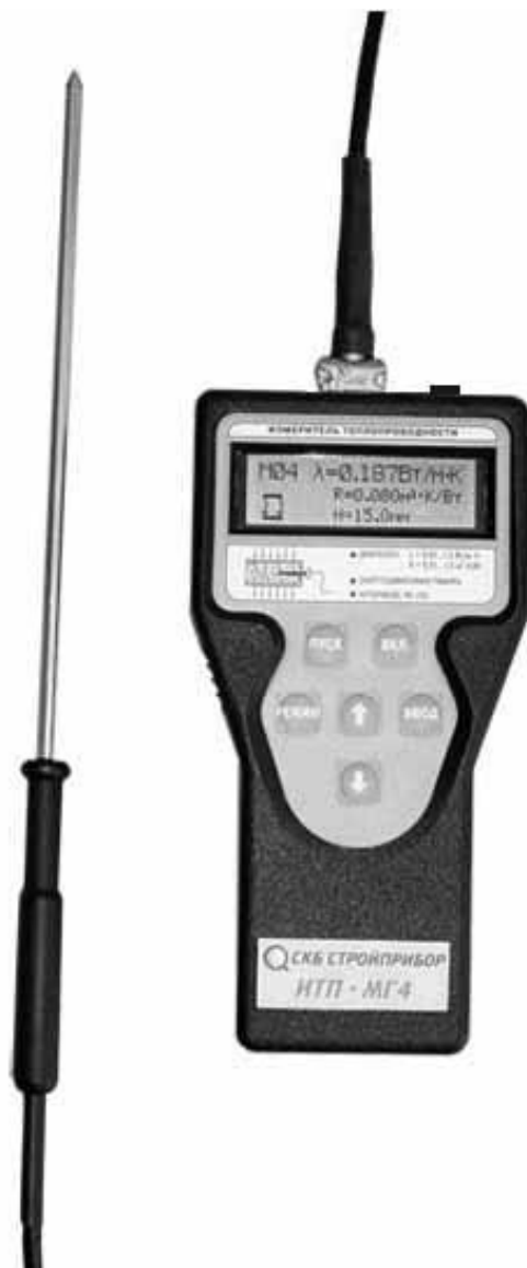
Рисунок 1.1 - Общий вид прибора ИТП-МГ4 «Зонд»