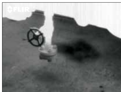
Утечка метана на предприятии по производству природного газа