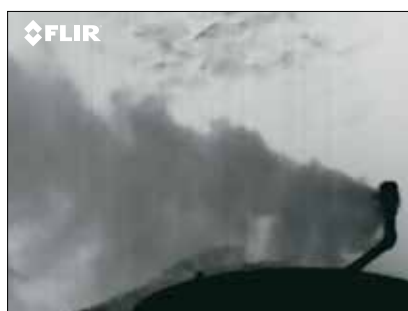
Выход газа из клапана сброса давления в емкости для хранения