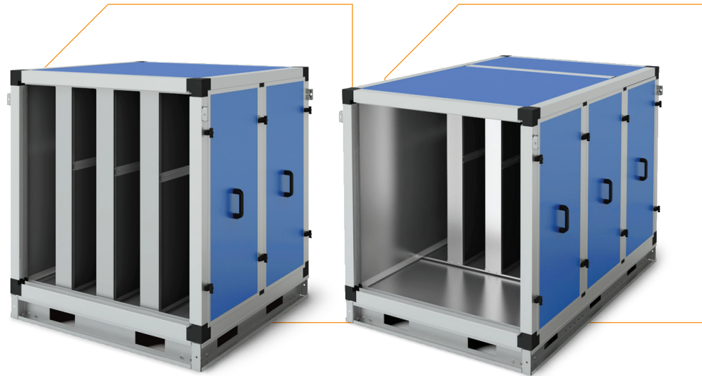
секция шумоглушения удлиненная