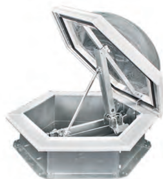
Открывающийся зенитный фонарь КЛАПАР®-ФВ с основанием шестигранной формы

По специальному заказу могут быть изготовлены зенитные фонари с пирамидальной крышкой и фонари с шестигранной формой основания и сферическим куполом.