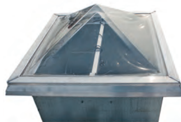
Глухой зенитный фонарь КЛАПАР®-Ф с пирамидальной крышкой