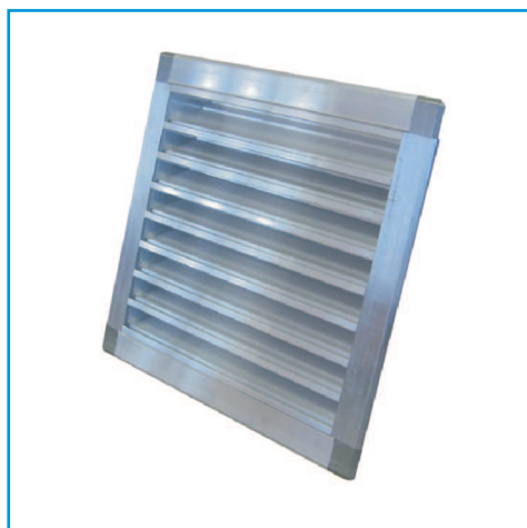
Решетка алюминиевая VKR(A)