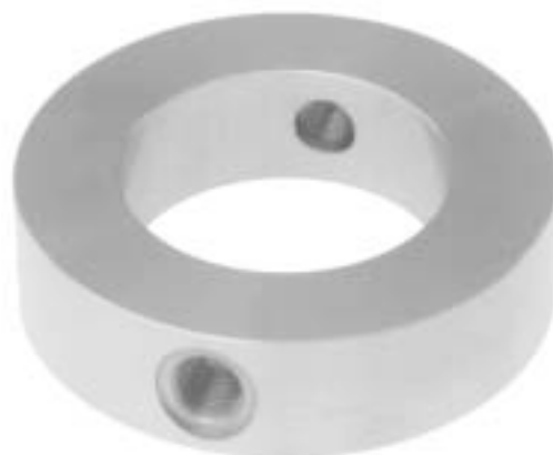
Проставка Модель 910.27