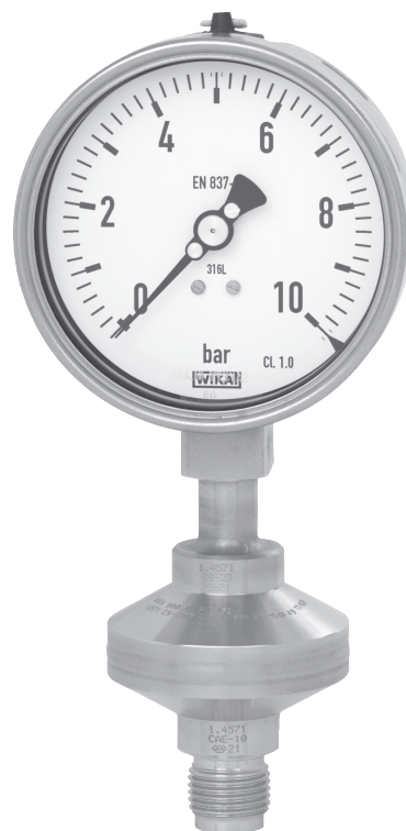
Мембранный разделитель, модель 990.34, Mb 52 мм, резьбовое технологическое соединение G ½ В (наружная), с манометром давления, модель 232.50 номин. размер 100