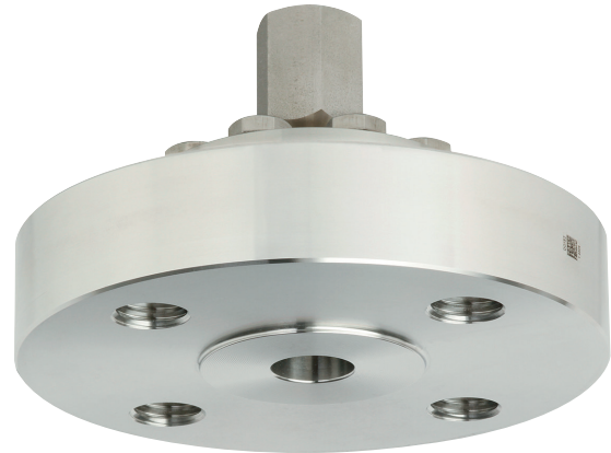
Мембранный разделитель с фланцевым присоединением, модель 990.16

Более подробная техническая информация о мембранных разделителях и системам мембранных разделителей приведена в документе IN 00.06 "Применение, принцип действия, конструкции".