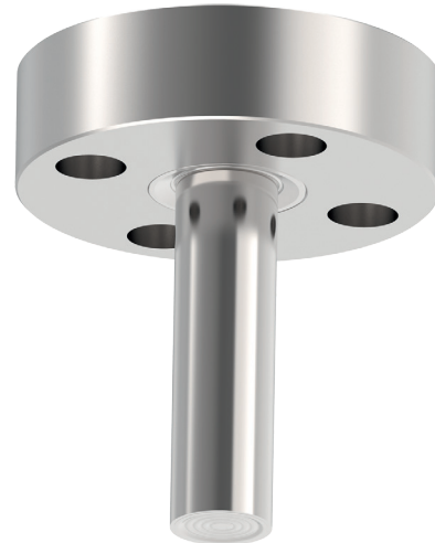
Мембранный разделитель с фланцевым присоединением, модель 990.49