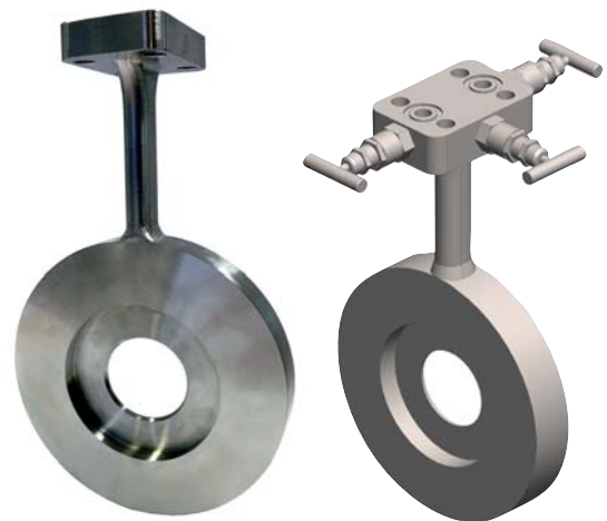
Рис. слева : Для непосредственного монтажа преобразователей дифференциального давления

Перепад давления, создаваемый первичным элементом измерения расхода, обычно преобразуется датчиком дифференциального давления в электрический сигнал, пропорциональный значению расхода.