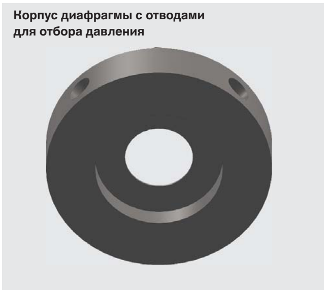
Корпус диафрагмы с отводами для отбора давления

По запросу может быть исполнение в зависимости от конкретных требований заказчика (например, измерение параметров пара через ниппель, резервуары для конденсата, клапаны)