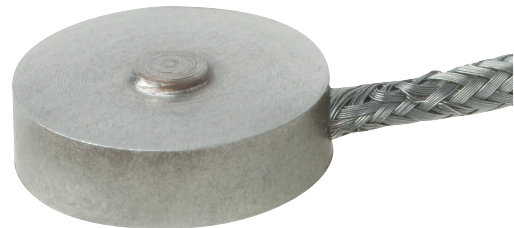
Компактный тензодатчик силы сжатия, модель F1222