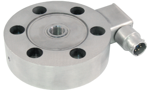
Тензодатчик растяжения/сжатия, модель F2229