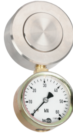
Гидравлический преобразователь силы сжатия, модель F1106