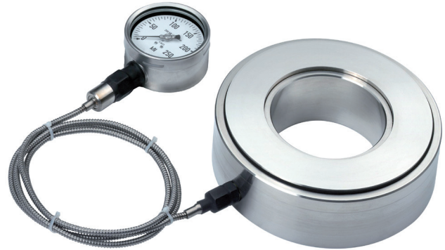
Гидравлический кольцевой преобразователь силы, модель F6154

Присоединение показывающего прибора опционально возможно через капилляр или измерительный шланг. Это обеспечивает удобство отображения измеряемой величины. Более того, измерительный шланг оснащен герметичным быстроразъемным соединителем, который позволяет заменять показывающий прибор без необходимости демонтажа всего устройства измерения силы.