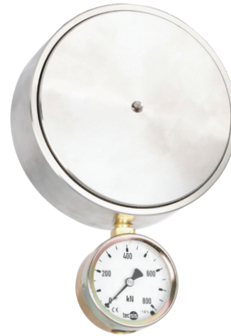
Гидравлический преобразователь силы сжатия, модель F1145

Работа гидравлических преобразователей силы основана на принципе преобразования силы, действующей на поршень, в гидравлическое давление, пропорциональное площади поршня. Оценка измеренной величины производится с помощью аналогового или цифрового измерительного прибора. Шкала показывающего прибора может быть проградуирована в различных единицах измерения (например, Н, кН, кг или т).