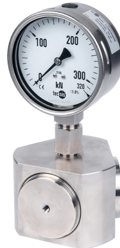
Гидравлический преобразователь силы сжатия, модель F1122