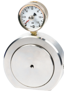
Гидравлический преобразователь силы сжатия, модель F1136

Измерение силы основано на гидравлическом принципе: сила, действующая на поршень, вызывает увеличение давления, которое регистрируется с помощью подключенного показывающего прибора. Шкала показывающего прибора может быть проградуирована в различных единицах измерения (например, Н, кН, кг, т).