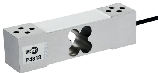
Консольный тензодатчик, модель F4818