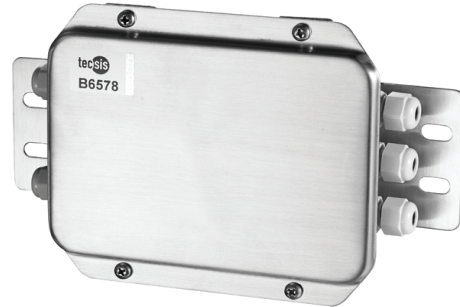
Распределительная коробка, модель B6578