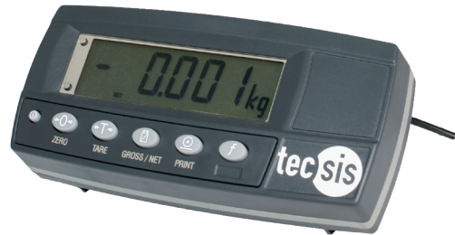
Тензометрический электронный весовой модуль, модель E1932

Также возможно исполнение цифрового весового модуля с максимально плоским корпусом с лицевой панелью из нержавеющей стали. Данная модель может поставляться также в корпусе из нержавеющей стали с IP65 для настенного или настольного монтажа.