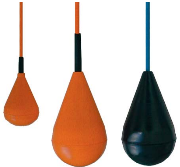
Рис. слева: Модель SLS-M2