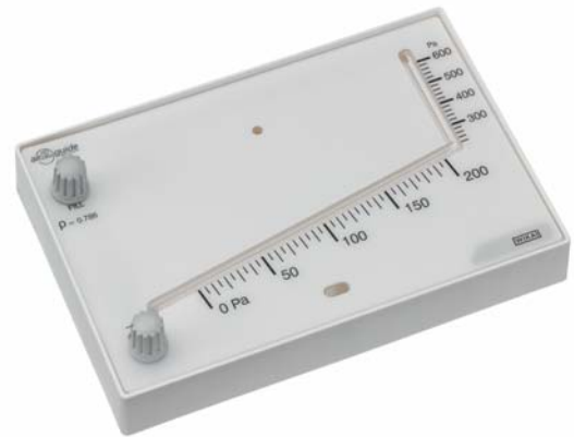
Манометр с наклонной трубкой, модель A2G-30