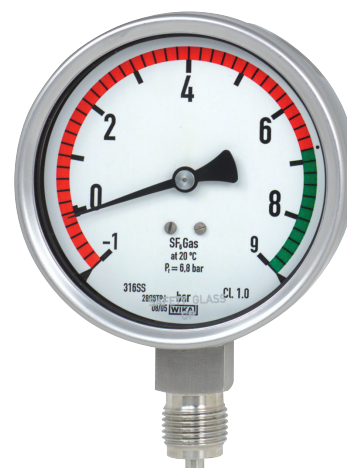
Монитор плотности газа, модель GDI-100

Благодаря локальному индикатору приведенное к 20 °C значение давления может считываться непосредственно на приборе.