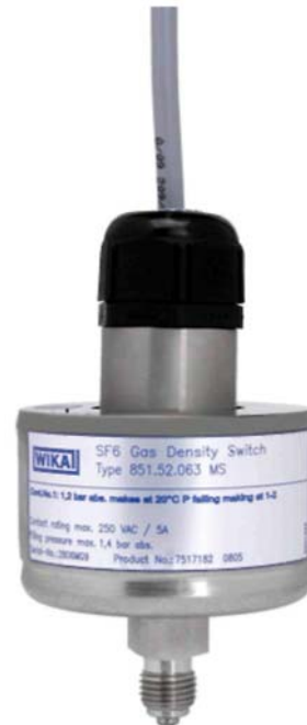
Реле плотности газа, модель 851.52.063 MS