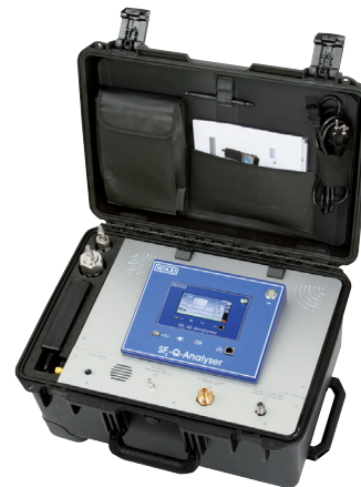
Аналитический прибор, модель GA11

Интуитивно понятная структура меню и 7» цветной сенсорный экран обеспечивают простоту эксплуатации. Датчики для измерения чистоты и влажности стандартно входят в комплект. Опционально модель GA11 может дополняться электрохимическими датчиками для определения продуктов распада элегаза.