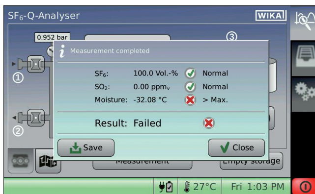
Экран измеренной величины

Модель GA11 позволяет легко и просто импортировать список точек измерения, редактируемый на ПК. Из-за сложности задачи измерения требуются специальные знания, см. МЭК 62271-4:2013, ASTM D2029-97:2017 и CIGRE - SF 6 Руководство по измерению (723).