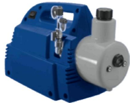
Переносной вакуумный насос, модель GVP-10