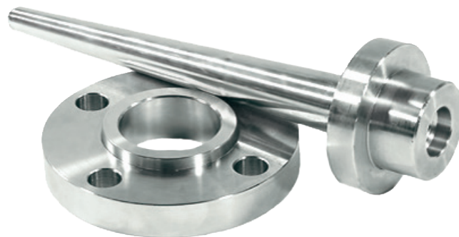
Защитная гильза, модель TW31 (опциональный свободно вращающийся фланец)