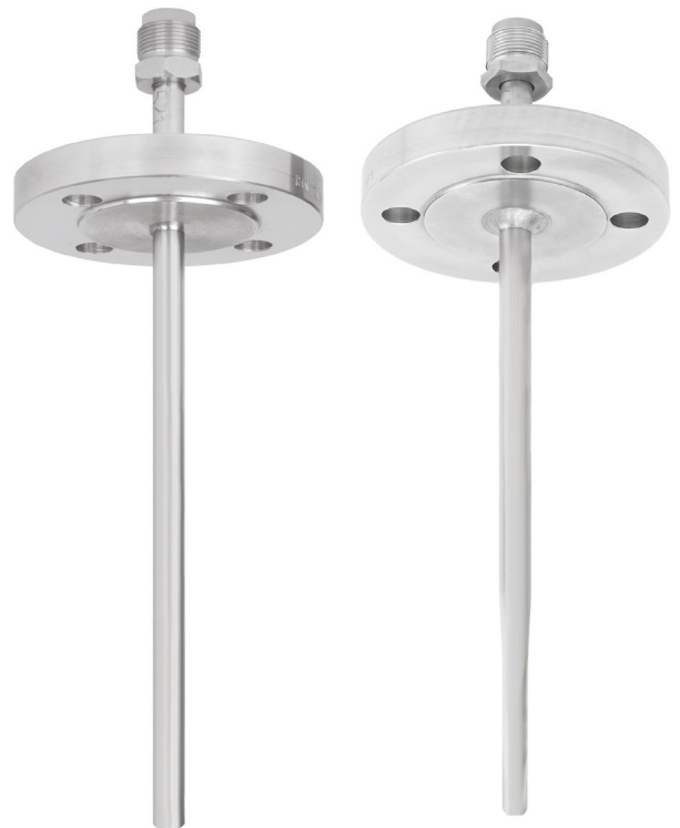
Рис. слева: гильза с фланцем, модель TW40-8 Рис. справа: гильза с фланцем, модель TW40-9