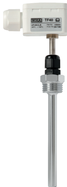
Модель TF40 с защитной гильзой