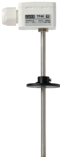
Модель TF40 с фланцем